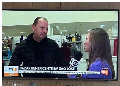
15/07/2025: Inauguração Associação Renal Vida - Unidade Florianópolis.