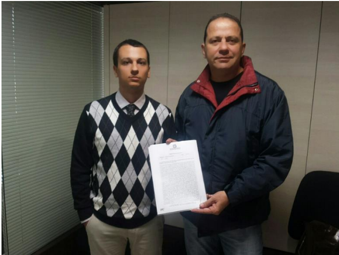
09/08/2016 - Reabertura Da Unidade De Tratamento Dialítico Do Hospital Universitário Polydoro Ernani – HU