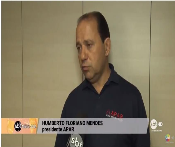
Falta de local para realizar cirurgias de pacientes de transplantes renais em Florianópolis